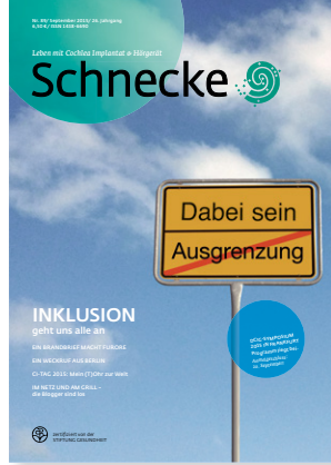
شنيكه العدد 89، سبتمبر 2015

تزدك المجلة المتخصصة المرموقة التي تصدر عن الجمعية الألمانية لزراعة القواقع السمعية بمعلوماتٍ ربع سنوية عن التقدم الطبي والتقني في العالم للسمع وكذلك عن أنشطة الجمعية ومجموعات المساعدة الذاتية. وتقدم هذه المجلة تقارير عن التجارب والخبرات وتعطي إرشاداتٍ حول التخطيط النشط للحياة. وتحتوي على مواعيد الفعاليات وعناوين التواصل. ويصدر كل عدد منها في 5500 نسخة. ولا يمكن الحصول عليها إلا عبر مكتب هيئة التحرير والاشتراكات.